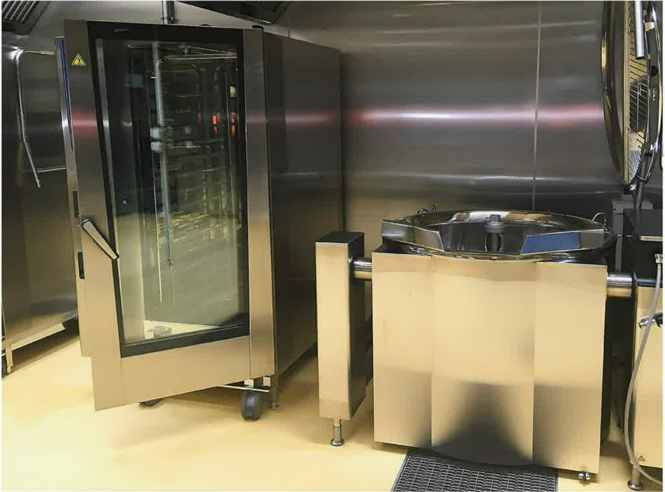
Uuden keskuskeittiön uutta kalustoa